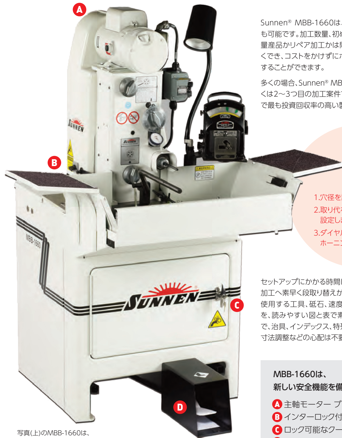
写真(上)のMBB-1660は、オプションのワークライト、ゲージ、ゲージスタンド、ドリフトレイが付いています。

Sunnen® MBB-1660は、 \phi 1.5\sim 165\text{mm} (内径)/ 3\sim 400\text{mm} (長さ)のあらゆる形状のボアホーニングに対応しています。標準的なまたは異形状ワークでも、材質を問わず、要求される穴径公差と幾何公差を、面粗度と共に保証します。更に、コストパフォーマンスにも優れています。MBB-1660によってのこれら基本性能を一挙に導入することができ、高い汎用性と経済性を兼ね備えたホーニング加工が実現します。